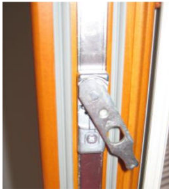
Slika 1: varovalo odpiranja NT/NX