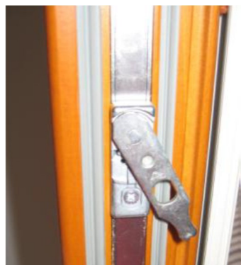
Slika 1: varovalo odpiranja NT/NX